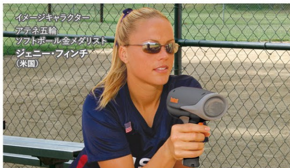
イタージキャラクター アテナ五輪 ソフトボール金メダリスト ジェニー・フィンチ (米国)