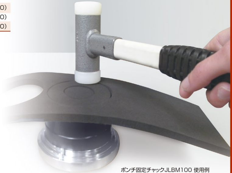
ポンチ固定チャックJLBM100 使用例