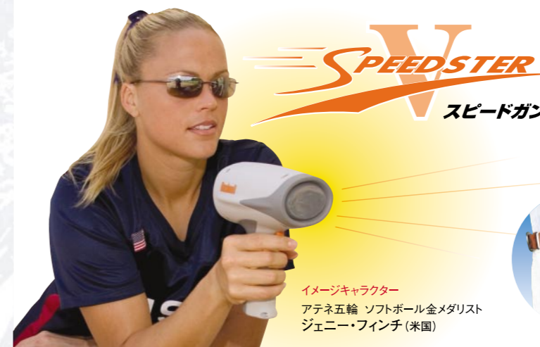
イメージキャラクター アテネ五輪 ソフトボール金メダリスト ジェニー・フィンチ(米国)